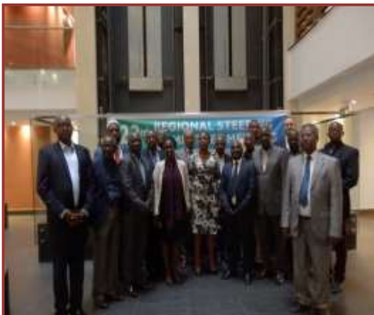
Atelier régional du Comité de Pilotage GWPEA-octobre 2017 tenu à Kigali

Partenaires privés: Donateurs privés Suisses, Allemands et Français, France Volontaire, Organismes étrangers : InterAgir, Paroisse Catholique de Prilly, COFORWA,