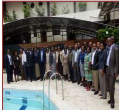
Atelier régional du Groupe de travail technique régional sur le programme PHE organisé par LVBC/EAC à Nairobi /Kenya