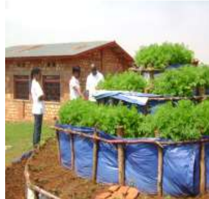
Construction des infrastructures d'assainissements dans les écoles, dans les communautés et vulgarisation des jardins potagers pour améliorer la sécurité alimentaire dans les ménages.