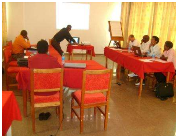
Réunion de travail avec Protos

Partenaires privés : Donateurs privés Suisses, Allemands et Français, France Volontaire, Savoror, Kinju Organismes étrangers : InterAgir, Paroisse Catholique de Prilly, COFORWA,