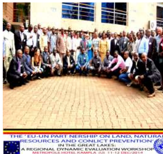
Deux délégués d'AVEDEC dans un séminaire d'échange international en Ouganda.