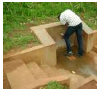
Approvisionnement en eau potable par la Construction des Infrastructures Hydrauliques (Réservoirs, Borne Fontaines, Source Aménagée)