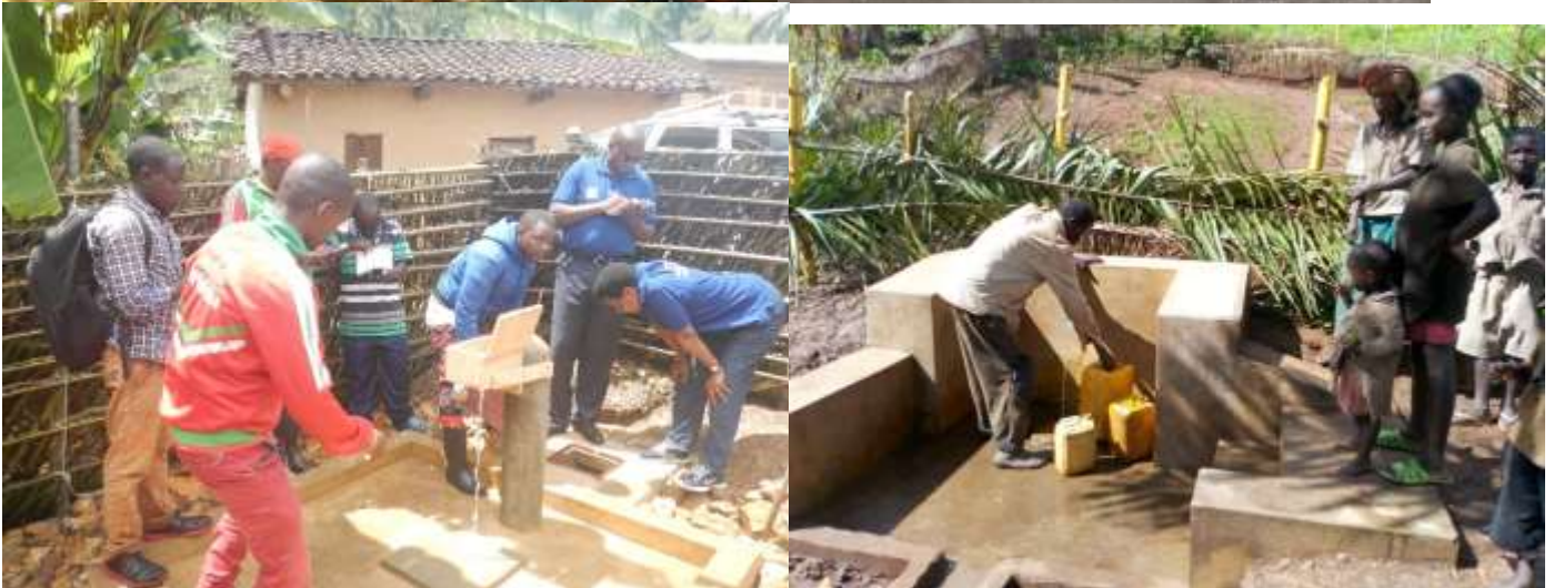
Construction de l'AEP KARINZI-GITANGA-NGARA (24.5 km)+Aménagement de 22 SA à Bubanza