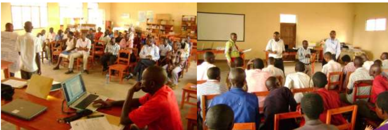
Des sessions de formations dispensées à l'endroit des différents acteurs