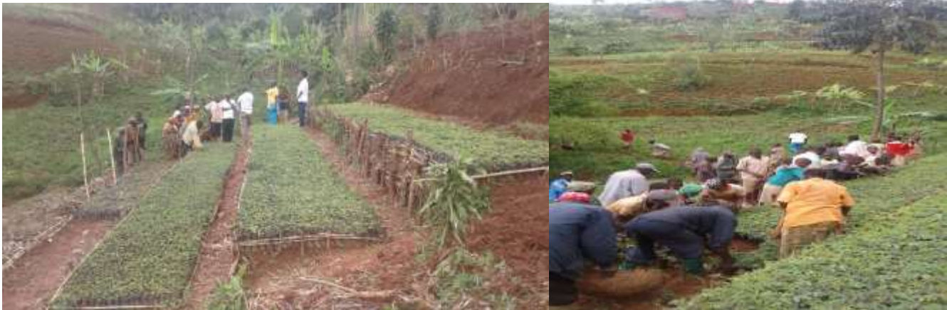
Encadrement des pépiniéristes sur la colline CIRISHA en commune ISARE, Province de Bujumbura