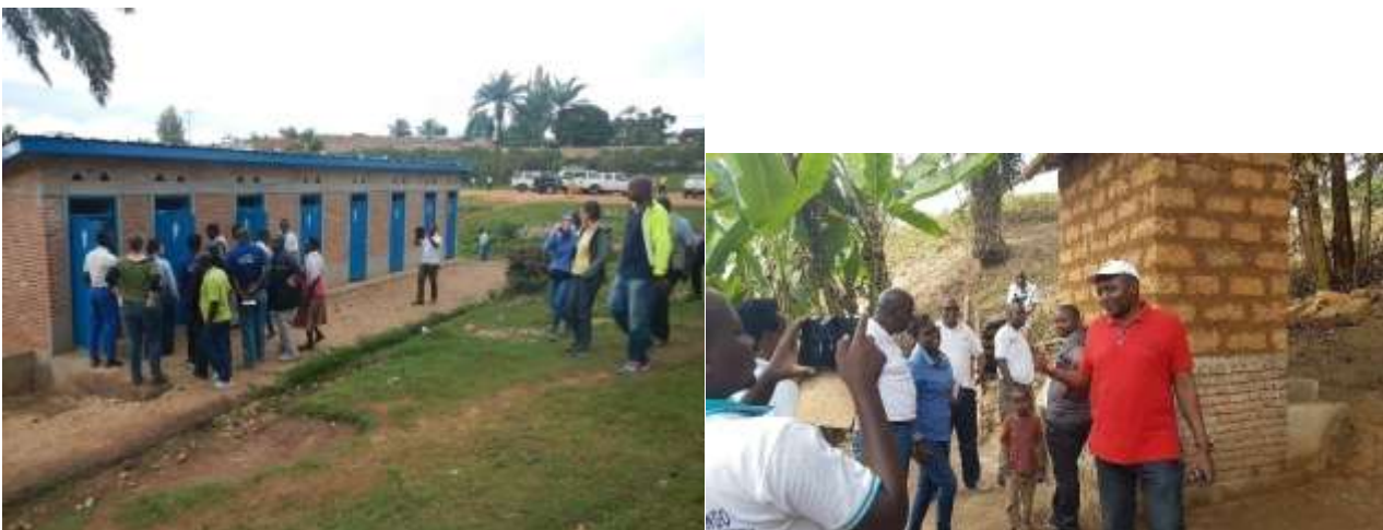
Construction de 6 Blocs de latrines EcoSan institutionnelles aux ECOFO Bubanza II, NGRA I & II et construction de 50 Latrines EcoSan ménages en commune Bubanza.